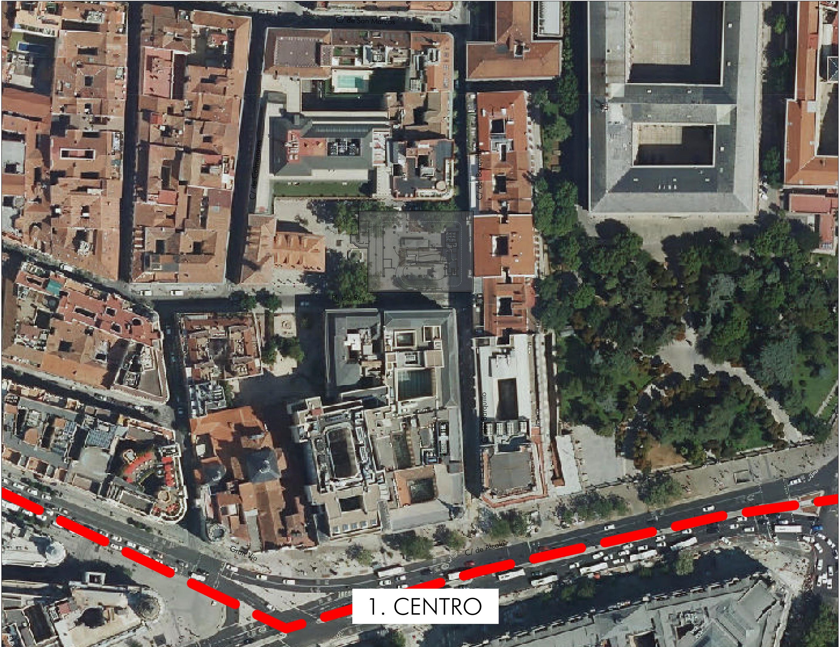
PLANO DE SITUACIÓN VISTA AEREA E: 1/1.000